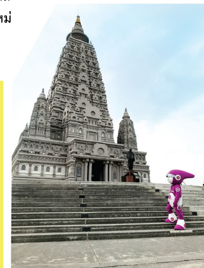
วัดปัญญานันทาราม

ภาพปริศนาธรรมสามมิติหนึ่งเดียวในโลก ภาพทั้งหมดถ่ายทอดเรื่องราวอริยสัจ 4 ได้อย่างลงตัว กลมกลืน และสอดคล้องกับบรรยากาศของวัด ซึ่งเป็นสถานที่ที่ทำให้เกิดปัญญา ภาพสามมิติเปิดให้เข้าชมทุกวัน เวลา 8.30-17.00 น.