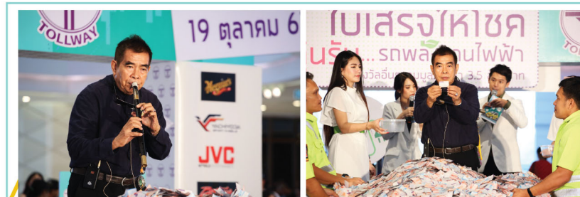
อาจารย์ธนิสร์ ศรีกลิ่นดี ศิลปินแห่งชาติ โชว์การแสดงและร่วมจับรางวัลให้กับผู้ใช้งานฯ

สาขาศิลปะการแสดง ประจำปี พ.ศ. 2559 ที่มาเป่าขลุ่ยสร้างบรรยากาศขับกล่อมลดความตึงตึงให้แก่ผู้ร่วมงาน จากนั้นมาช่วงสำคัญกับการจับรางวัลที่ 1 รถยนต์ไฟฟ้า ยี่ห้อ FOMM รุ่น ONE จำนวน 1 รางวัล มูลค่า 664,000 บาท โดยได้รับเกียรติจากพลเอกบัญชา ชวัลคลิปปิ อดีตผู้ทรงคุณวุฒิกองทัพบก / ประธานมูลนิธิธริกไทย ประธานภายในงานเป็นผู้จับรางวัล