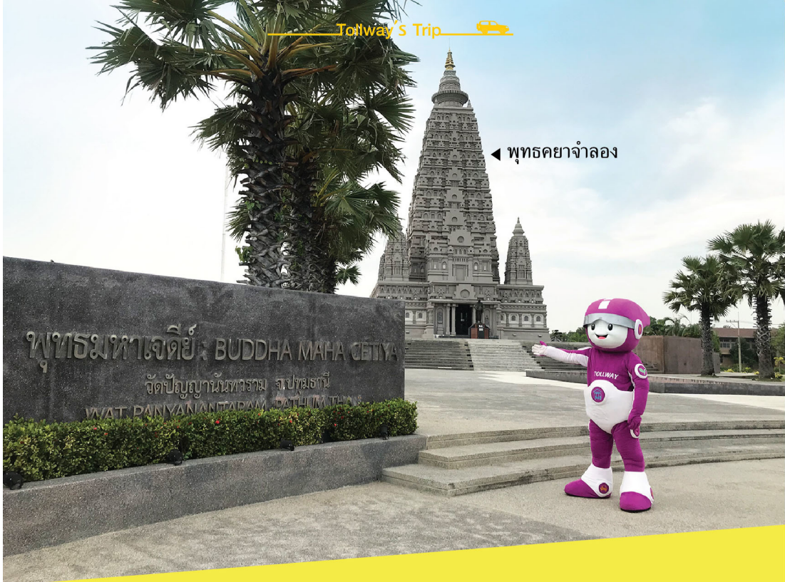
◀ พุทธมหาเจดีย์