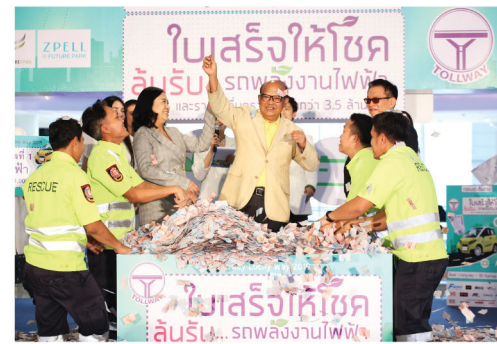
พลเอกบัญชา ชวัลคลิปปิ อดีตผู้ทรงคุณวุฒิกองทัพบก / ประธานมูลนิธิธริกไทย ให้เกียรติจับรางวัลที่ 1

เมื่อวันที่ 19 ตุลาคม 2562 บริษัท ทางยกระดับดอนเมือง จำกัด (มหาชน) ได้จัดงานจับรางวัลโครงการ “Tollway Lucky Way 2019” ณ ศูนย์การค้าพิวเจอร์พาร์ครังสิต ภายในงานได้รับเกียรติจากผู้บริหารโทลล์เวย์และผู้บริหารพันธมิตรที่สนับสนุนของรางวัลรวมถึงสื่อมวลชนร่วมเป็นสักขีพยานและให้เกียรติร่วมจับรางวัล จำนวน 871 รางวัล จากใบเสร็จที่ส่งเข้ามาซึ่งโชคกว่า 800,000 ชิ้น ทั้งนี้ภายในงานมีการแสดงจากอาจารย์ธนิสร์ ศรีกลิ่นดี ศิลปินแห่งชาติ