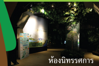
ห้องนิทรรศการ