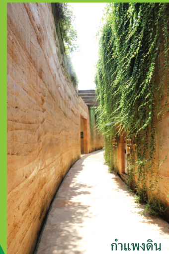
กำแพงดิน

ผู้ที่เข้ามาเที่ยวชมศูนย์เรียนรู้ “ป่าในกรุง” นอกจากจะได้สัมผัสบรรยากาศป่าที่ร่มรื่นและได้สูดโอโซนบริสุทธิ์อย่างเต็มปอดแล้ว อีกสิ่งหนึ่งที่จะได้รับกลับไปก็คือ การตระหนักถึงคุณค่าของการอนุรักษ์สิ่งแวดล้อม และได้แรงบันดาลใจในการเป็นส่วนหนึ่งที่จะช่วยรักษาธรรมชาติที่เป็นส่วนสำคัญในการปัญหาหลดมลภาวะในที่เกิดขึ้นในปัจจุบัน