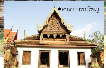
● ศาลาการเปรียญ

วัดเชิงท่า เป็นวัดเก่าแก่สร้างขึ้นในสมัยกรุงศรีอยุธยา แต่ไม่ปรากฏหลักฐานว่าใครเป็นผู้สร้าง เป็นแหล่งโบราณสถานสำคัญของชาติ ภายในบริเวณวัดมีงานศิลปกรรมไทยสมัยอยุธยาตอนปลายในรูปแบบสถาปัตยกรรม ประติมากรรม และจิตรกรรมหลายอย่าง