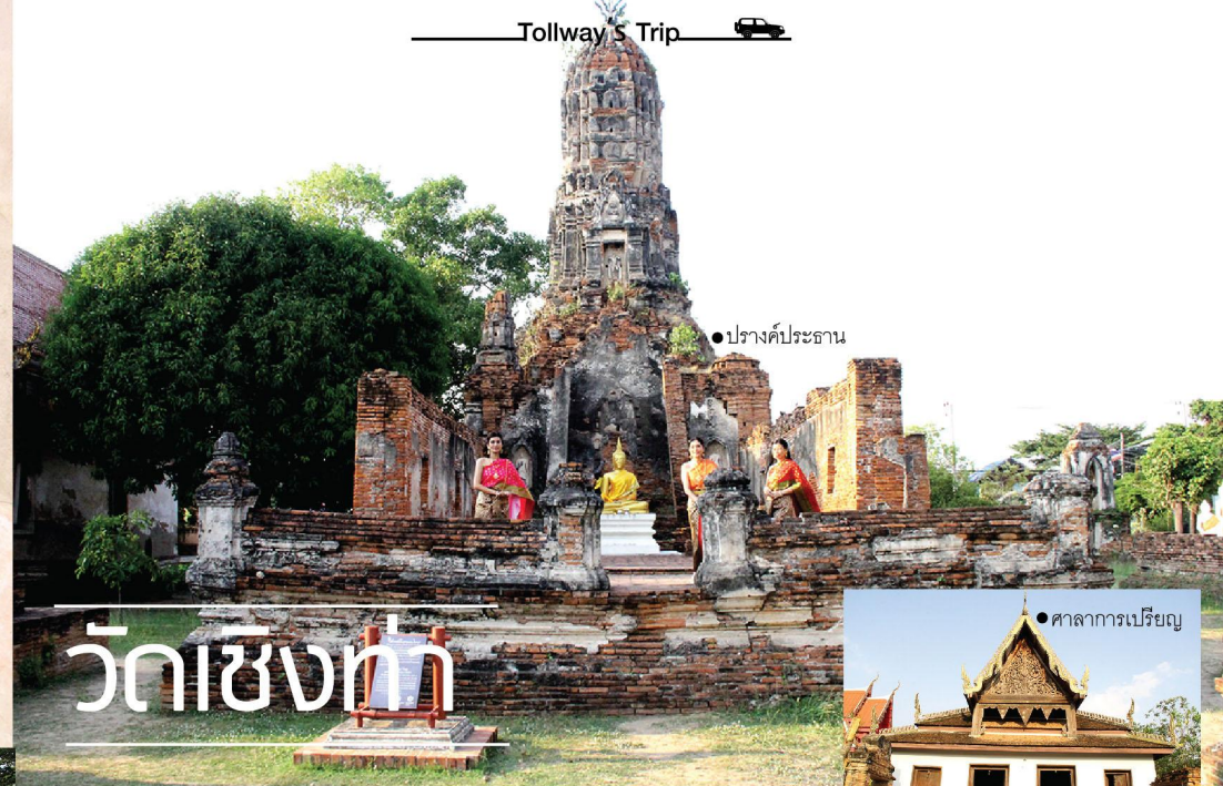
● ปราสาทประธาน