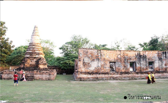
● วิหารพระนอน