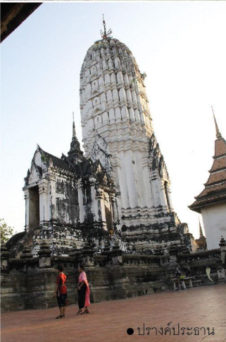
● ปราสาทประธาน

วัดพุทธโศคารวรรย์ เป็นพระอารามหลวงที่ใหญ่โตและมีชื่อเสียงวัดหนึ่ง ปรากฏตามตำนานว่าสมเด็จพระรามาธิบดีที่ 1 (พระเจ้าอู่ทอง) ทรงสร้างขึ้นในบริเวณที่ตั้งเป็นที่ตั้งพลับพลาที่ประทับเมื่อทรงอพยพมาตั้งอยู่ก่อนสถาปนากรุงศรีอยุธยาเป็นราชธานี ตั้งอยู่ริมแม่น้ำเจ้าพระยาฝั่งตะวันตก วัดพุทธโศคารวรรย์เป็นอีกวัดหนึ่งที่มีได้ถูกข้าศึกทำลายเหมือนวัดอื่น ๆ ทุกวันนี้จึงยังมีโบราณสถานเก่าแก่ไว้ให้เที่ยวชม ไม่ว่าจะองค์พระนอนองค์ใหญ่ ปราสาทประธานสีขาวที่สวยงาม เป็นศิลปะแบบอยุธยาผสมขอมตั้งเด่นเป็นสง่า นอกจากนี้ยังมีแถวของพระพุทธรูปที่ประดิษฐานเรียงกันอยู่อย่างสวยงามตรงระเบียงคดที่ตั้งอยู่ภายในวัด