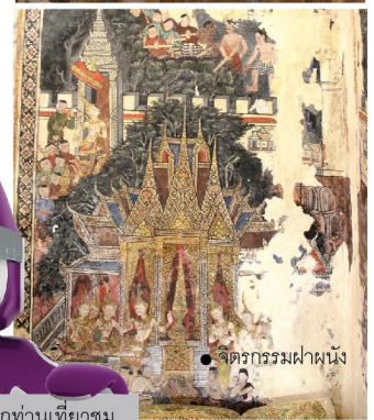
● จิตรกรรมฝาผนัง