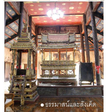
● ธรรมาสน์และสังเค็ด

ส่วนโบราณสถานที่สำคัญปรากฏอยู่ทุกวันนี้ ได้แก่ ปราสาทประธาน ซึ่งเป็นของสมัยอยุธยา มีลักษณะพิเศษเฉพาะตัวพบที่นี้เพียงแห่งเดียว นั่นคือการก่อสร้างพระปราสาทขึ้นมาเป็นทรงแท่งสี่เหลี่ยมจตุรัสที่ด้านทั้งสี่สร้างวิหารยื่นออกไปในลักษณะแผนผังรูปกากบาทหรือไม้กางเขน นอกจากนี้ยังมีศาลาการเปรียญ ซึ่งสร้างขึ้นในสมัยรัชกาลที่ ๔ ภายในมีของดีของงามคือธรรมาสน์ (ที่นั่งสำหรับพระสงฆ์แสดงธรรม) และสังเค็ด (ธรรมาสน์สวดสำหรับพระสงฆ์นั่งสี่รูป) ฝีมือปราณีตงดงาม รวมถึง จิตรกรรมฝาผนังเรื่องพุทธประวัติอันเก่าแก่และงดงาม