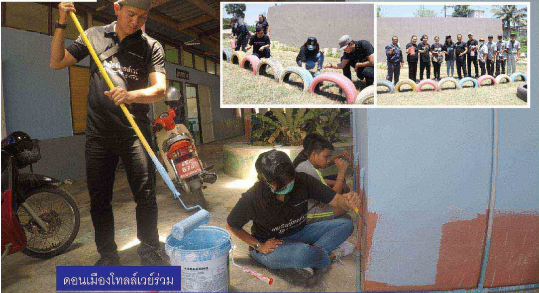
ดอนเมืองโทลล์เวย์ร่วม