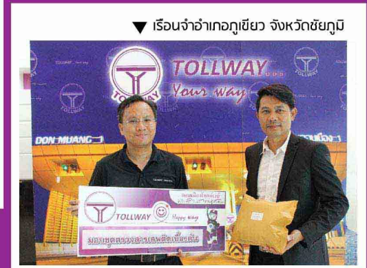
▼ เรือนจำอำเภอกุฉินารายณ์ จังหวัดชัยภูมิ

ตัวแทนผู้บริหารดอนเมืองโทลล์เวย์ ร่วมมอบชุดตรวจสอบเสพติดเบื้องต้นให้กับหน่วยงานเพื่อนำไปใช้ประโยชน์ อันจะเป็นแนวทางการป้องกันการติดสารเสพติด