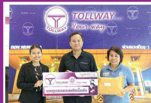
▲ กักตุนน้ำบาดพิศษหญิง ปทุมธานี