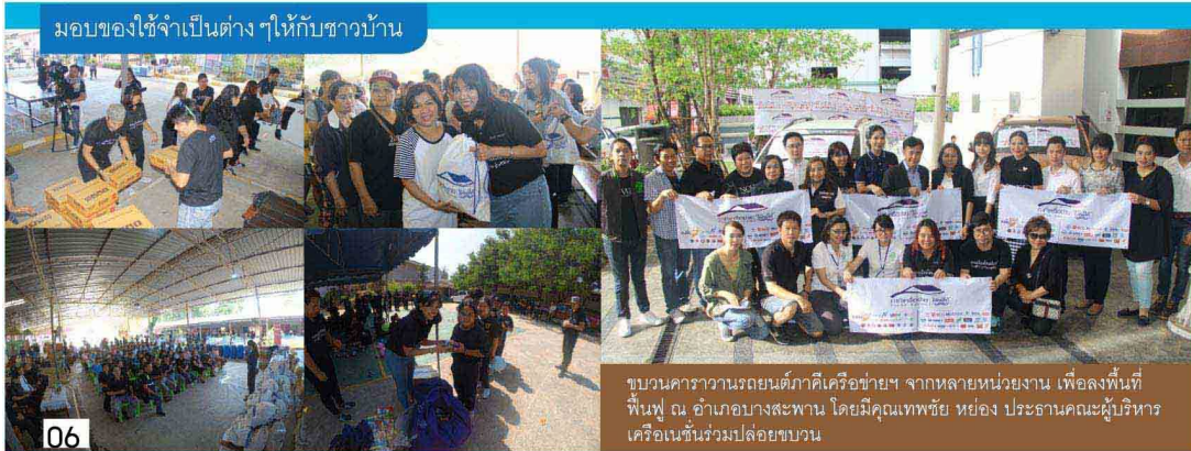
มอบของใช้จำเป็นต่าง ๆ ให้กับชาวบ้าน