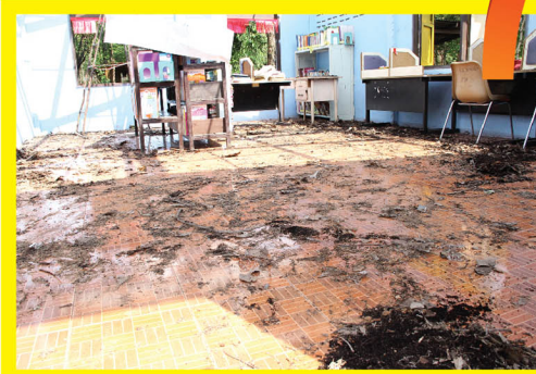
บรรยากาศสภาพภายในของห้องสมุด ก่อนที่พนักงานจิตอาสาจะร่วมมือกัน ปรับปรุง