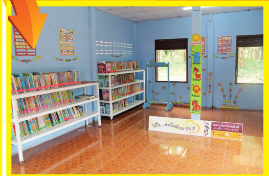
บรรยากาศภายในห้องสมุดที่เสร็จ เรียบร้อยมอบให้กับโรงเรียนบ้าน ดอนหัน

ปีนี้ดอนเมืองโทลล์เวย์ ได้จัดทีมลงพื้นที่ทำกิจกรรมขึ้นในรูปแบบการปรับปรุง และซ่อมแซมห้องสมุดพร้อมทั้งมอบสื่อการเรียนการสอน อุปกรณ์การเรียน และอุปกรณ์กีฬา ให้กับโรงเรียนบ้านดอนหัน อ.เกษตรสมบูรณ์ จ.ชัยภูมิ เนื่องจากสภาพห้องสมุดของร.ร.ที่เสื่อมสภาพและทรุดโทรมไปตามกาลเวลา โดยก่อนหน้านี้เวลาฝนตก คุณครูและนักเรียนไม่สามารถใช้ห้องสมุดได้ เพราะจากหลังคาที่เป็นรูทำให้น้ำรั่วไหลลงมา รวมถึงสื่อการเรียนการสอนที่ ทางโรงเรียนต้องประดิษฐ์ขึ้นมาเองไม่มีการซื้อใหม่แต่อย่างใด เนื่องจากงบประมาณที่ได้รับการสนับสนุนนั้นไม่เพียงพอต่อการจัดซื้อ