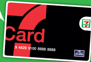
บัตรสมาชิก 7-Card