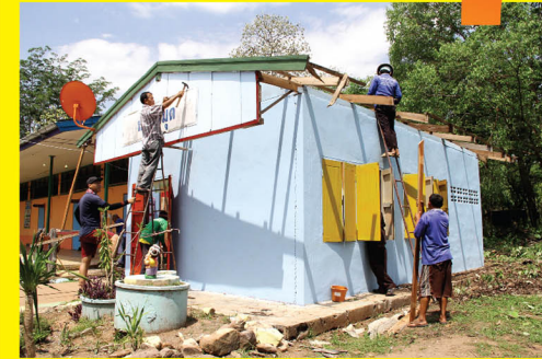
สภาพบรรยากาศด้านนอกของอาคารห้องสมุดก่อนพนักงานจิตอาสา ร่วมทำการปรับปรุง

ในครั้งนี้นักคณะครูและนักเรียน รวมไปถึงผู้ปกครองบ้านดอนหัน รู้สึกขอบคุณทางบริษัทดอนเมืองโกลด์เวย์ และทีมพนักงานจิตอาสาเป็นอย่างมาก ที่ให้ความช่วยเหลือทั้งกำลังใจและกำลังกายร่วมมือช่วยกันปรับปรุงห้องสมุดแห่งนี้ จนเสร็จสมบูรณ์กลับมาใช้งานได้ใหม่อีกครั้ง