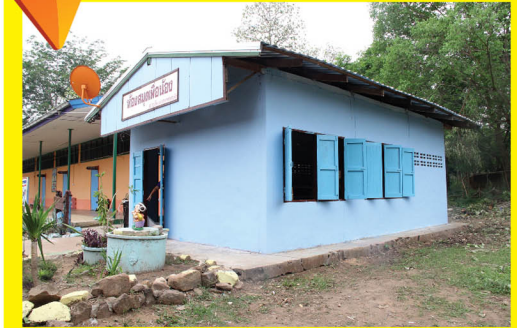
สภาพบรรยากาศด้านนอกของอาคารห้องสมุดที่ปรับปรุงเสร็จเรียบร้อย พร้อมมอบให้โรงเรียนบ้านดอนหัน

กิจกรรมในครั้งนี้ถึงแม้จะเหน็ดเหนื่อยเพียงใด เหล่าพนักงานจิตอาสาไม่มีบ่นสักคำ พร้อมร่วมแรงร่วมใจกันทำห้องสมุดให้กับน้อง ๆ โรงเรียนบ้านดอนหันให้ได้ทันใช้กันก่อนเปิดเทอมอย่างสนุกสนานด้วยใบหน้าเปื้อนรอยยิ้มของทุกคน แต่ทั้งหมดทั้งมวลการทำซีเอสอาร์ของดอนเมืองโกลด์เวย์นั้น คือ การมองสังคมรอบข้างและร่วมขับเคลื่อนสังคมไทยให้เกิดการพัฒนาอย่างยั่งยืนที่สุด