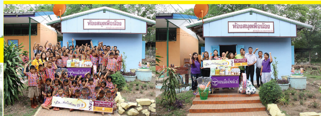
พนักงานจิตอาสาช่วยถ่ายภาพ กับห้องสมุดใหม่และเด็ก ๆ ที่ใบหน้ายิ้มแย้ม พร้อมกันนี้ยังได้มอบอุปกรณ์การเรียนการสอนให้กับโรงเรียนบ้านดอนหันอีกด้วย