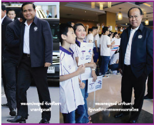
พลเอกประยุทธ์ จันทร์โอชา นายกรัฐมนตรี พลเอกสุพงษ์ แสงจินดา รัฐมนตรีว่าการกระทรวงมหาดไทย