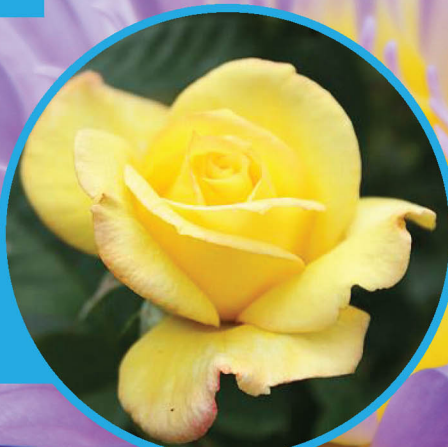
กุหลาบควีนสิริกิติ์ Queen Sirikit Rose