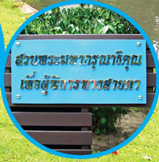
สวนพระมหากรุณาธิคุณ เพื่อผู้พิการทางสายตา