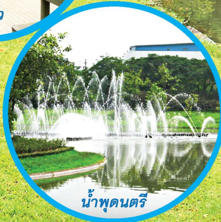
น้ำพุดนตรี