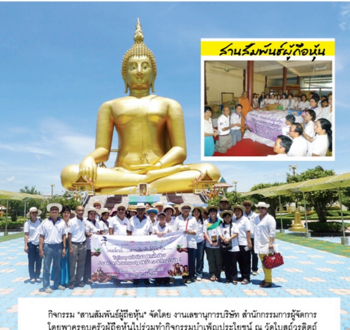
ร้านสัมพันธ์ผู้ถือหุ้น

กิจกรรม "สานสัมพันธ์ผู้ถือหุ้น" จัดโดย งานเลขานุการบริษัท สำนักกรรมการผู้จัดการ โดยพาครอบครัวผู้ถือหุ้นไปร่วมทำกิจกรรมบำเพ็ญประโยชน์ ณ วัดโบสถ์วรดิตต์ อ.ป่าโมก จ.อ่างทอง ร่วมบริจาคสิ่งของที่จำเป็นอาทิ ข้าวสาร อาหารแห้ง มาฉานม ขนม เสื้อผ้า อุปกรณ์การเรียน กีฬา ฯลฯ แก่ทางวัด พร้อมทั้งร่วมกันปลูกต้นไม้ในวัดดังกล่าว